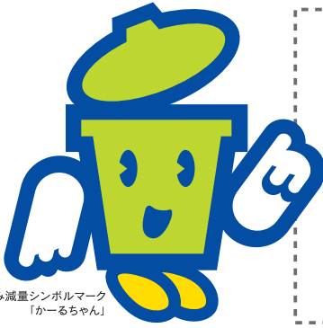
ごみ減量シンボルマーク 「かーるちゃん」